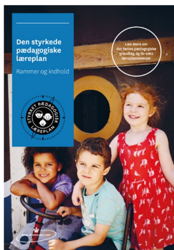
Den styrkede pædagogiske læreplan. Rammer og indhold

Inden for de krav, der følger af dagtilbudsloven, er det op til jer at beslutte, hvordan I konkret vil arbejde med den pædagogiske læreplan. Jeres læreplan skal være et dynamisk og meningsfuldt dokument, som peger fremad, og som I kan bruge aktivt i den løbende udvikling af den pædagogiske kvalitet og jeres pædagogiske praksis.