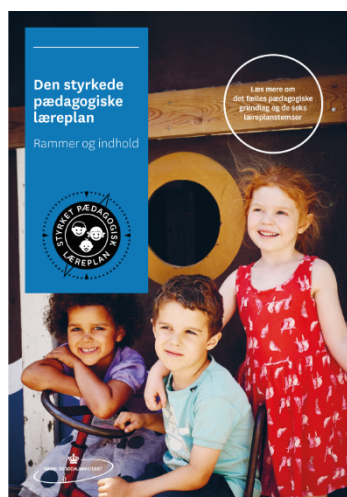
Den styrkede pædagogiske læreplan. Rammer og indhold

Inden for de krav, der følger af dagtilbudsloven, er det op til jer at beslutte, hvordan I konkret vil arbejde med den pædagogiske læreplan. Jeres læreplan skal være et dynamisk og meningsfuldt dokument, som peger fremad, og som I kan bruge aktivt i den løbende udvikling af den pædagogiske kvalitet og jeres pædagogiske praksis.